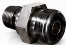
ADAPTADOR MÉTRICAS - ORFS