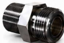
ADAPTADOR BSPT - ORFS