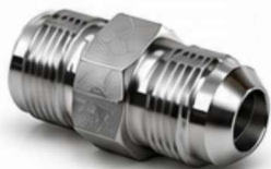
ADAPTADOR JIC - MACHO 37°