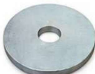
USINADO ARRUELA ESPECIAL