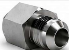
ADAPTADOR JIC - FÊMEA FIXO