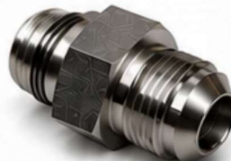
ADAPTADOR JIC - MACHO UNF COM ANEL ORING