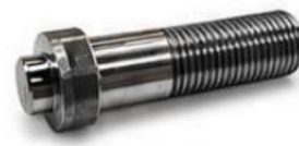
USINADO PEÇA ROSCADA