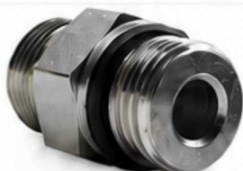
ADAPTADOR DIN - UNF