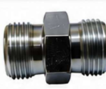
ADAPTADOR DIN - IGUAL (UDA)