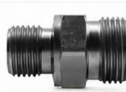
ADAPTADOR DIN - MÉTRICO