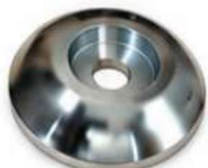
USINADO ARRUELA CÔNICA