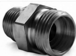
ADAPTADOR DIN - BSP