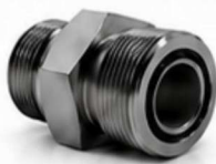
ADAPTADOR BSP - ORFS