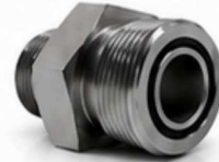
ADAPTADOR NPT - ORFS