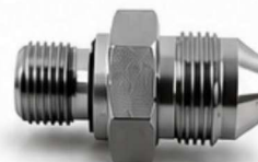
ADAPTADOR JIC - MACHO MÉTRICO COM ANEL ED