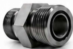
ADAPTADOR ORFS - BSP 60°