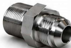
ADAPTADOR JIC - MACHO X NPT MACHO