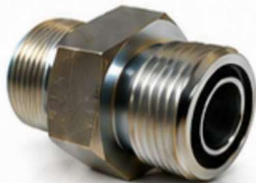
ADAPTADOR UNF - ORFS