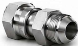
ADAPTADOR JIC - MACHO JIC FÊMEA GIRATÓRIO