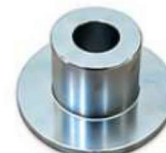
USINADO FLANGE USINADA