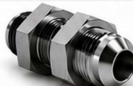
ADAPTADOR JIC - PAINEL