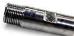
USINADO PINO ROSCADO