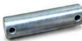
USINADO PINO USINADO