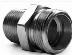
ADAPTADOR DIN - NPT