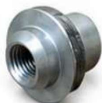
USINADO BUCHA ESPECIAL