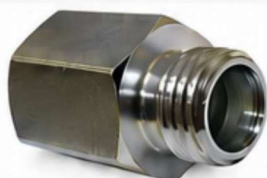
ADAPTADOR DIN - FÊMEA BSP