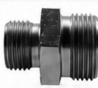
ADAPTADOR DIN - REDUÇÃO (UDRA)