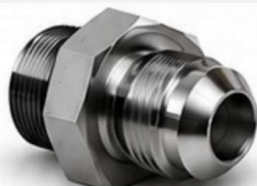
ADAPTADOR JIC - MACHO BSP COM ANEL ED