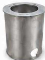
BALDE DE INSPEÇÃO