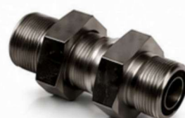
ADAPTADOR ORFS - PAINEL