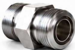
ADAPTADOR ORFS - ORFS