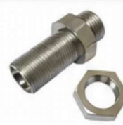
ADAPTADOR DIN - PAINEL